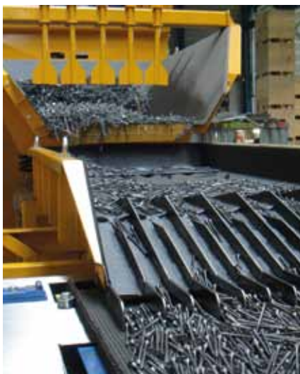
Trémie vibrante (jusqu'à 2 tonnes) pour l'alimentation de four