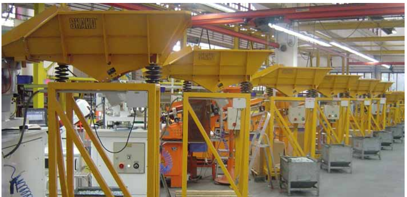
Trémie vibrante en série pour le chargement de machines de filetage