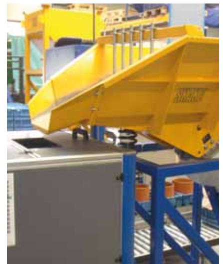
Trémie vibrante avant machine de tri