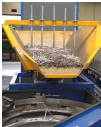
Alimentation de bol vibrant